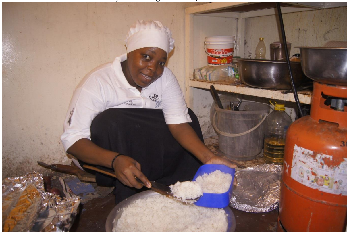
De primitieve kookegelegenheid