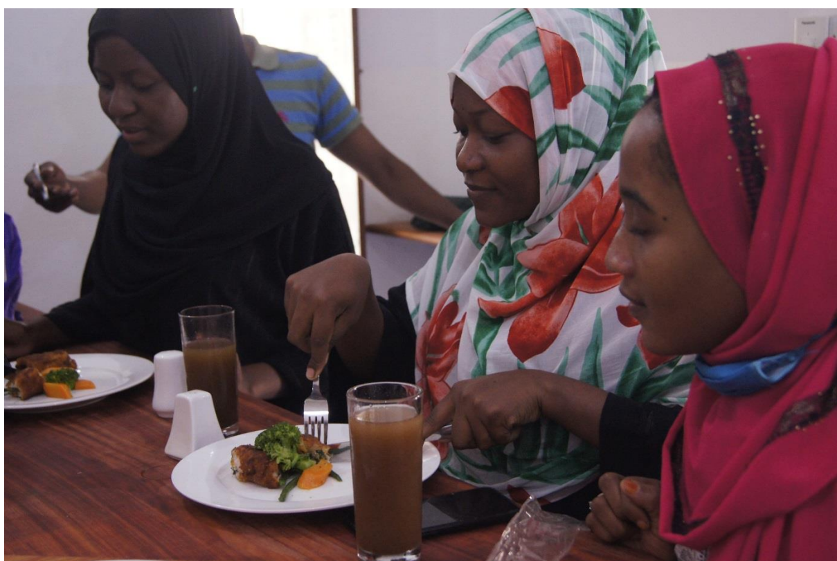
Studenten van een andere cursus & praktijkbegeleiders als testpanel