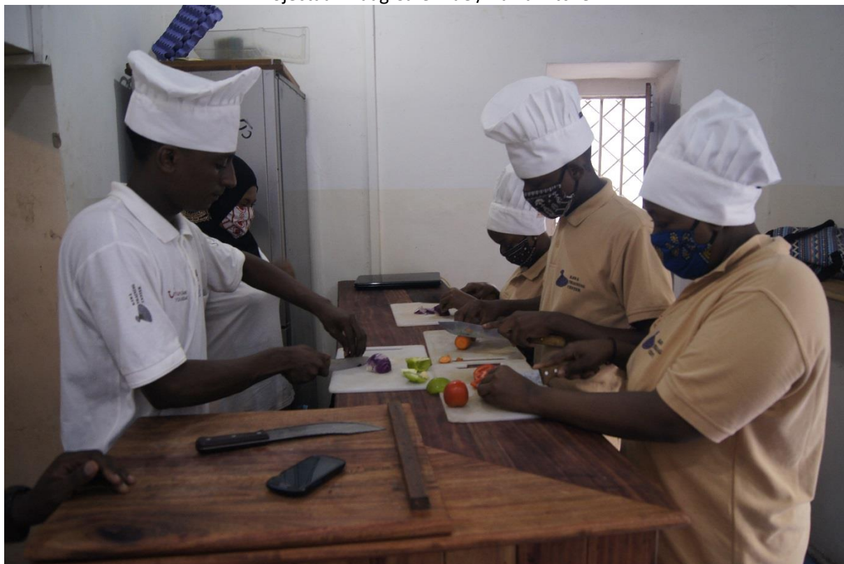
De multifunctionele counter