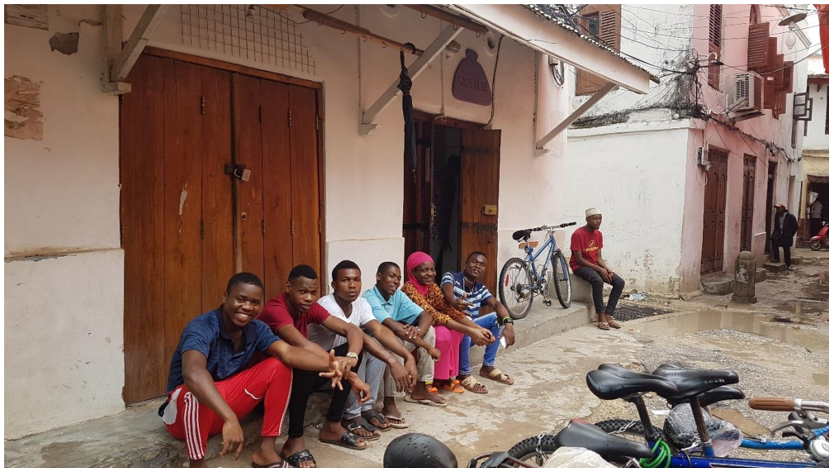
De locatie op de hoek met een deel van de KTC studenten

Vliegende start & improvisatie om de studenten praktijkervaring te bieden na uitval van alle stage adressen