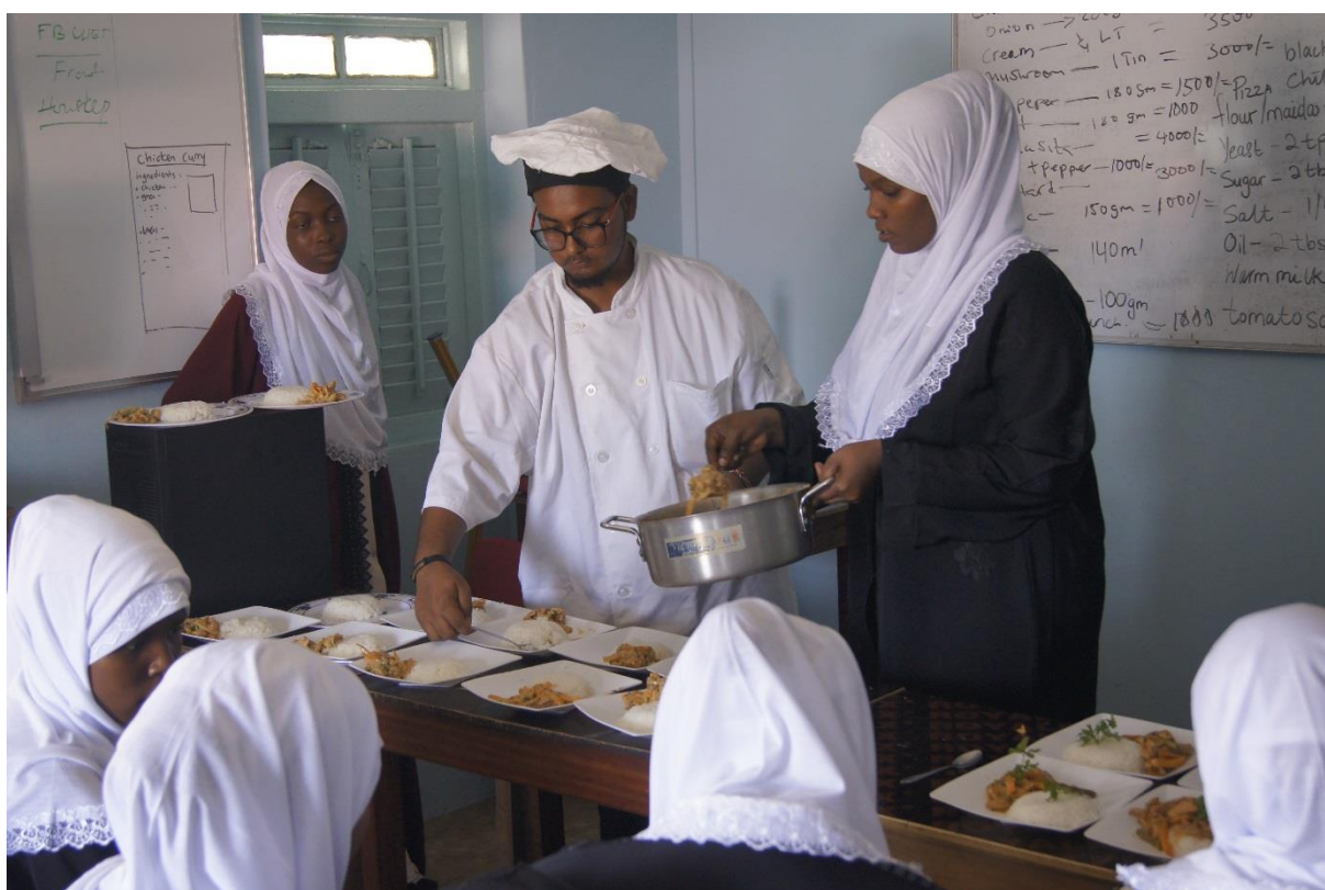
Van de begane grond worden de componenten naar de lesruimte op de 3 e etage gebracht om het gerecht samen te stellen en op te dienen

Stichting Panda Juu Jacob Pronkstraat 62 2584 BT Den Haag